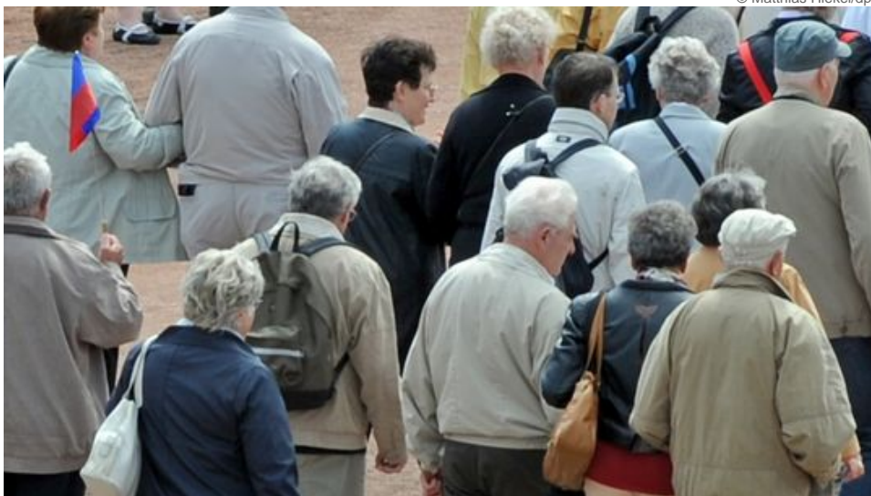
Eine Seniorengruppe in Dresden